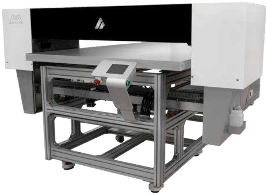
Impressoras de plataforma UV LED industriais

A Azon MATRIX abrange uma ampla variedade de aplicações! Com o seu sistema de lâmpada de cura UV LED eficiente e duradouro, a tinta adere instantaneamente e eficientemente a qualquer tipo de substrato. A sua plataforma robusta e o sistema de vácuo integrado, o software Azon RIP completo e a tecnologia de tinta UV TurboJet assegura um resultado perfeito em todas as impressões.