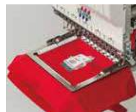
▲ Pneumático Tipo Pinça