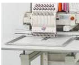
▲ Campo Aberto