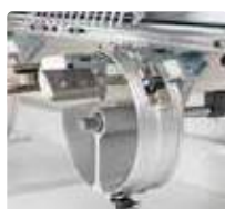
Bastidor Amplo de Bonés Reforçado